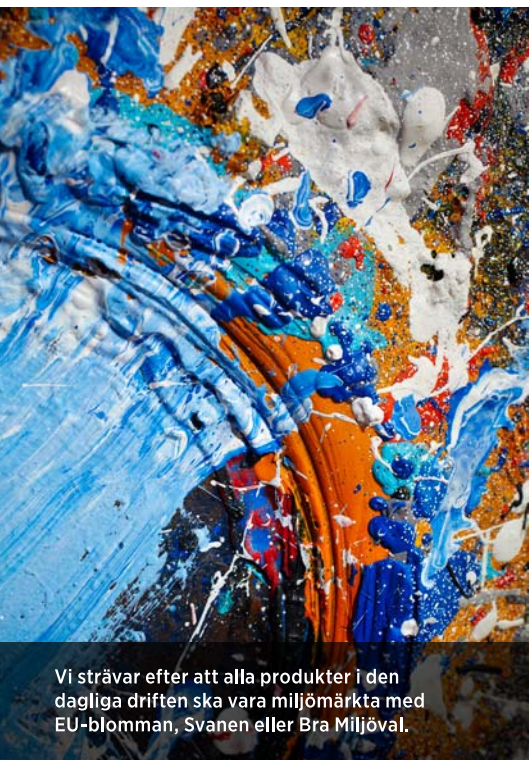
Vi strävar efter att alla produkter i den dagliga driften ska vara miljömärkta med EU-blomman, Svanen eller Bra Miljöval.