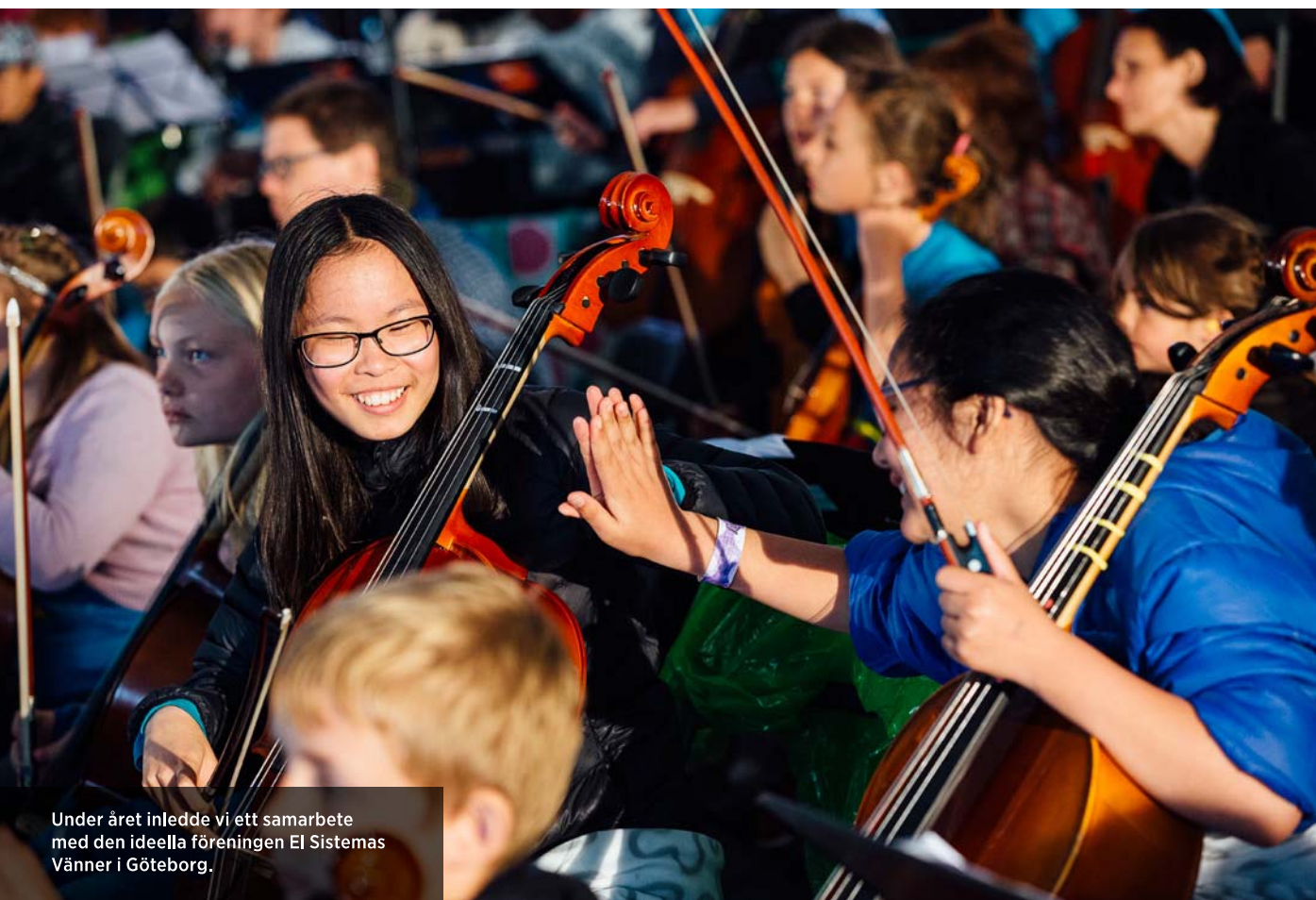
Under året inledde vi ett samarbete med den ideella föreningen El Sistemas Vänner i Göteborg.