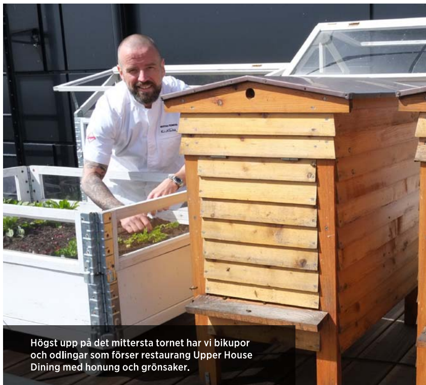
Högst upp på det mittersta tornet har vi bikupor och odlingar som förser restaurang Upper House Dining med honung och grönsaker.